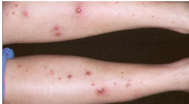
Imagen 4. Forunculosis