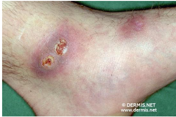
Imagen 2. Ectima.