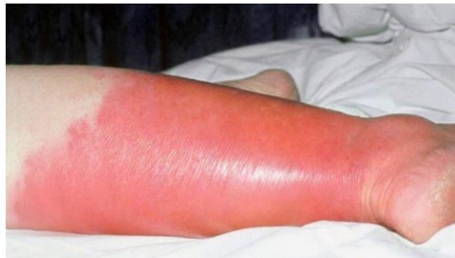
Imagen 6. Erisipela