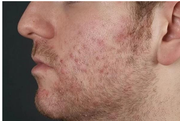
Imagen 3. Foliculitis.