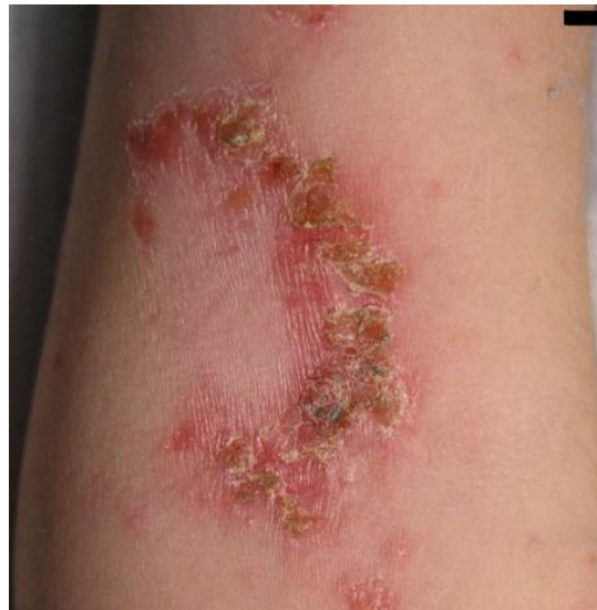
Imagen 1. Impétigo no bulloso o costroso.