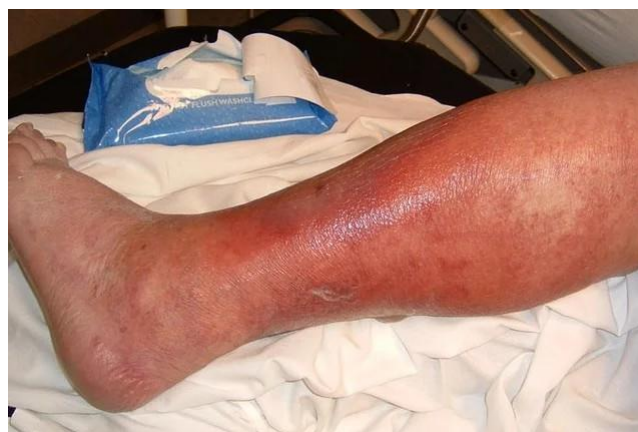
Imagen 7. Celulitis